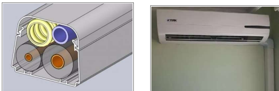
Figura 2. Modelo de canaleta de PVC e acessórios.

É importante atentar para não ocorrer esmagamento ou redução do isolamento térmico de forma a evitar a formação de condensado. Todas as emendas do isolamento devem ser feitas com cola especial, unidas por adesivo elastomérico com 3 mm de espessura. A tubulação frigorífica, dreno e cabos elétricos, nos locais internos e aparente devem ser todos suportados em canaletas de PVC conforme modelo ilustrado na Figura 2.