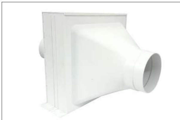
Figura 3. Caixa de filtragem em ABS.