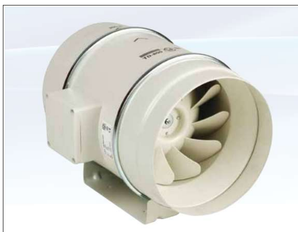
Figura 2. Ventilador helicocentrífugo – inline.

Os ventiladores são helicocentrífugos - inline, de baixo perfil, fabricados em material plástico, com caixa de bornes externa, corpo motor desmontável e motor regulável 220V-60Hz, de duas velocidades, Classe B, IP44 rolamentos de esferas de lubrificação permanente e protetor térmico. Conforme apresentado de forma ilustrativa na Figura 02.