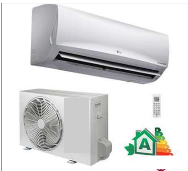
Figura 1. Climatizador Split high wall.