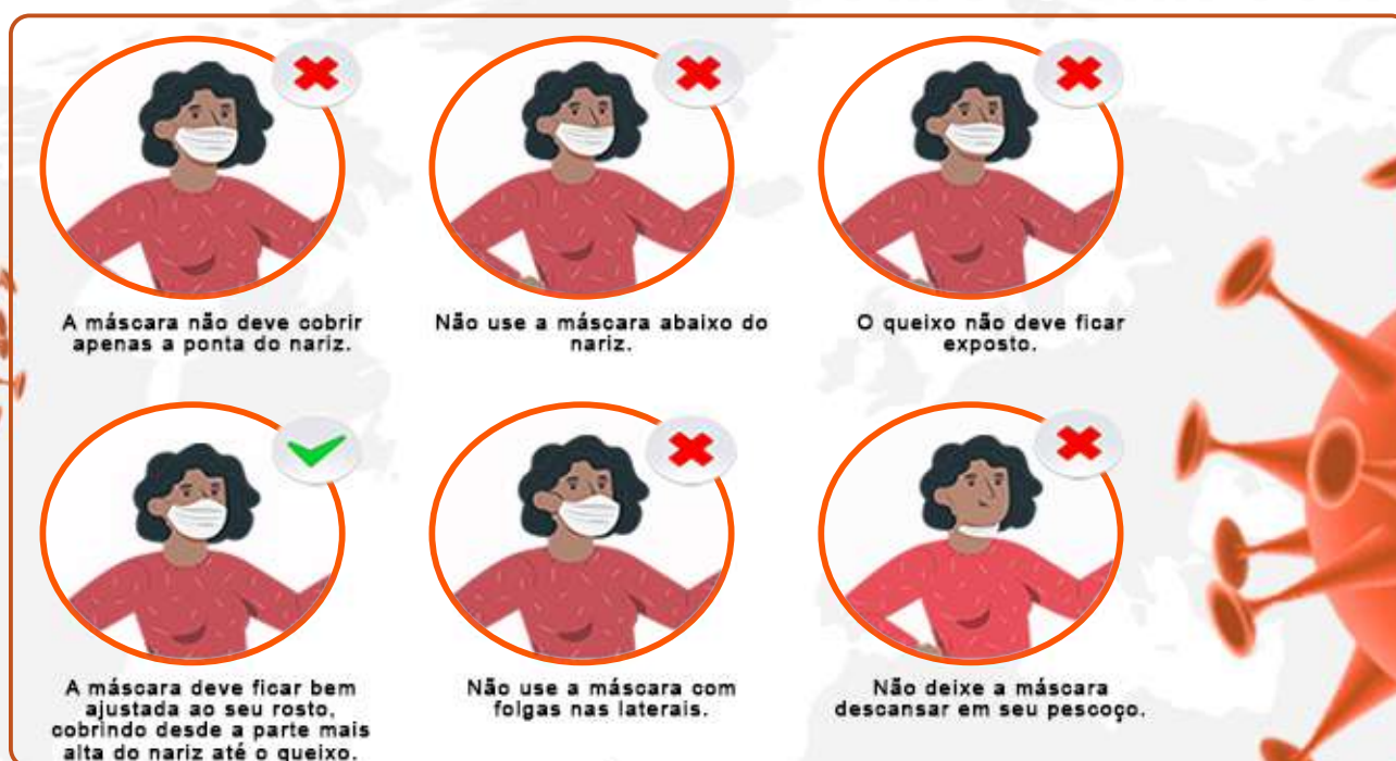
FIGURA - 4: ILUSTRAÇÃO DE COMO USAR A MÁSCARA DA MANEIRA CORRETA.