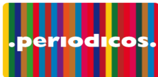
Portal de Periódicos

1. Acesse o sítio do Portal de Periódicos, por meio do endereço http://www.periodicos.capes.gov.br ou pelo sítio da CAPES http://www.capes.gov.br e clique no banner do Portal de Periódicos.